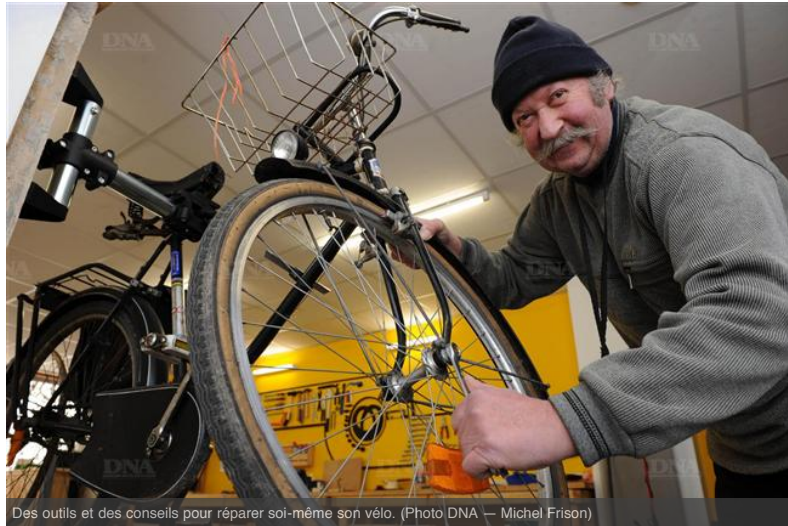
Des outils et des conseils pour réparer soi-même son vélo.

A l'atelier de réparation de vélos qui ouvre ses portes mercredi au centre-ville, on ne viendra pas la bouche en cœur et les doigts manucurés présenter sa roue voilée au réparateur. Comme le dit le slogan, chez Bretz'selle, c'est le client qui fait le mécano.